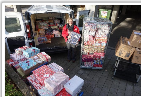
Abholungen in München durch die Helfer in München

Der Weihnachtspäckchenkonvoi begann schon im Sommer für die Verantwortlichen und Helfer in München und in ganz Deutschland. Flyer und Plakate wurden gedruckt und an mehrere hundert Einrichtungen in München verschickt. Im Herbst begannen dann die Abstimmungen mit den Einrichtungen, dazu wer teilnimmt und wie viele Päckchen zusammenkommen. Wenn alle Einrichtungen zurückgemeldet haben, planen die Mitglieder von Ladies Circle und Round Table die Abholungen auf den verschiedenen Routen durch München. Am 24. und 25. November 2017 machten sich dann dutzende Helfer auf den Weg zu den Einrichtungen in München um die dort gepackten Päckchen einzusammeln.