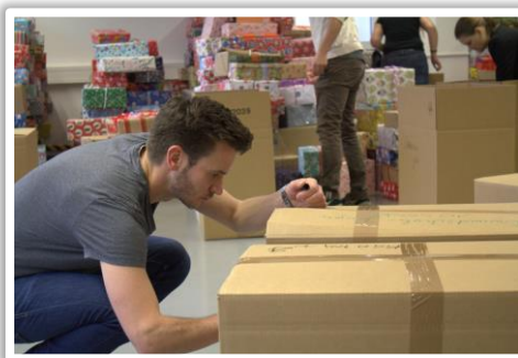
Verpacken der Weihnachtspäckchen aus München