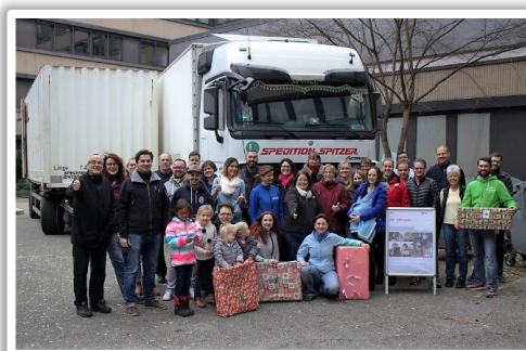
Beladung des LKW aus München für den Transport

Als eine von 25 überregionalen Sammelstellen in Deutschland ist das WPS Center der BMW AG, auch 2017 wieder Kooperationspartner des Weihnachtspäckchenkonvois. Dort werden die Päckchen von den Abholtouren in ganz München, aus dem Kreis Starnberg und Landshut angeliefert und für den Weitertransport vorbereitet. Am 26. November 2017 kamen dutzende Helfer zur Sammelstelle und verpackten die einzelnen Päckchen in Umkartons und verladen diese in den LKW der Spedition Spitzer, welche auch in 2017 den Transport von München ins Zentrallager nach Koblenz durchgeführt und gesponsert hat. In diesem Jahr sind insgesamt 4686 Päckchen zusammengekommen und verladen worden.